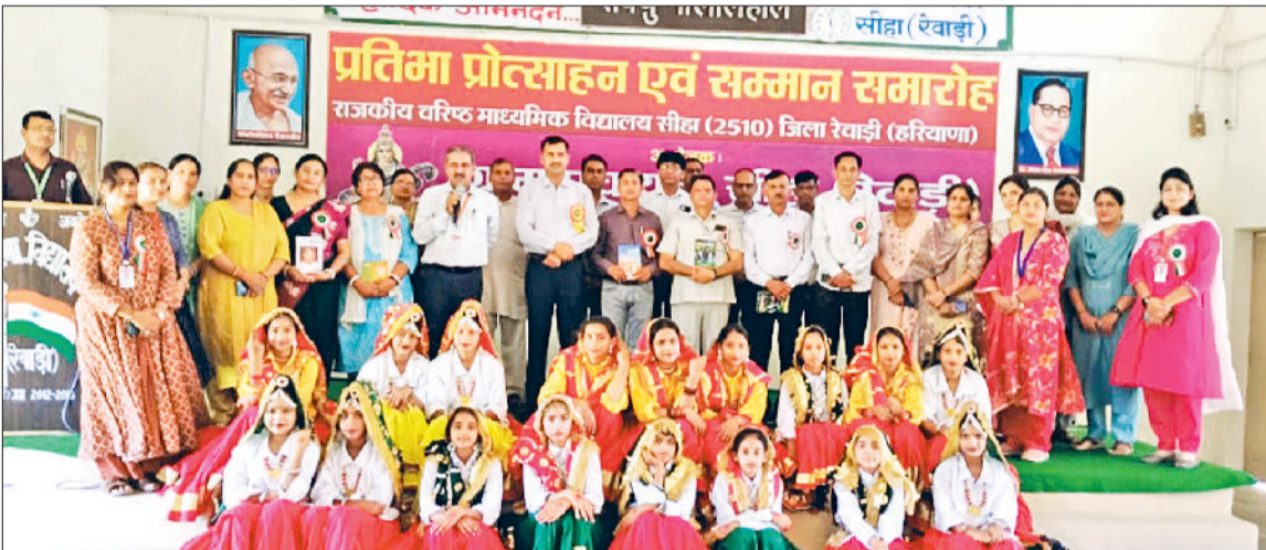
डहीना। ग्रुप डांस प्रतिभागियों के साथ मुख्य अतिथि एवं आयोजन समिति सदस्य।