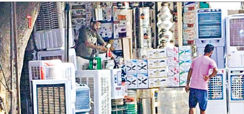
रेवाड़ी। एक दुकान पर कूलर देखते हुए युवक।

दोपहर के समय घरों से बाहर निकलना मुश्किल हो गया। गत वर्ष की तुलना में दिन का तापमान लगभग सामान्य बना हुआ है, जबकि रात का तापमान सामान्य से ज्यादा है। सड़कों से लेकर बाजार तक सुनसान नजर आए। दो दिन से भारी गर्मी का प्रकोप जमकर परेशान कर रहा है।