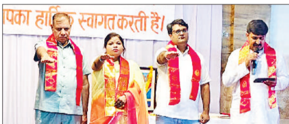
रेवाड़ी। कार्यक्रम में शपथ लेते हुए पदाधिकारी।