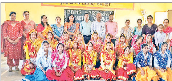
कोसली। उत्कृष्ट प्रदर्शन करने वाले विद्यार्थियों के साथ प्राचार्य एवं स्टाफ सदस्य।