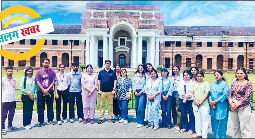
रेवाड़ी। मीरपुर स्थित इंदिरा गांधी विश्वविद्यालय।

बायोटेकनोलॉजी विभाग में सत्र 2026-27 के लिए एमएससी बायोटेकनोलॉजी पाठ्यक्रम में प्रवेश प्रक्रिया शुरू कर दी गई है। विश्वविद्यालय प्रशासन ने विद्यार्थियों से समय रहते आवेदन करने की अपील की है। विश्वविद्यालय की ओर से जारी जानकारी के अनुसार विभाग में आधुनिक लैब, उन्नत